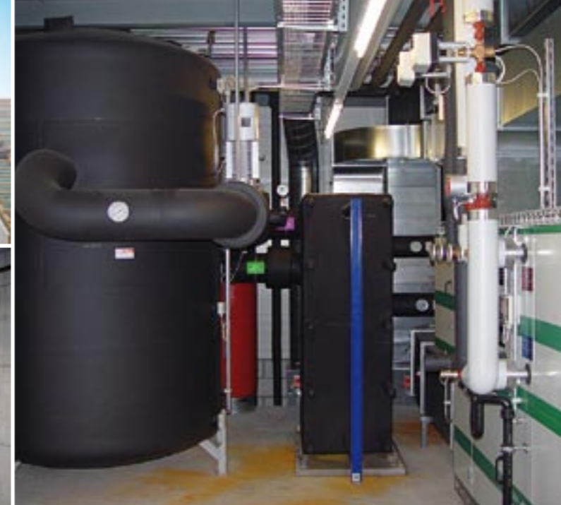
Heizungsanlagen in Wohn- und Geschäftshäusern, Öffentlichen Gebäuden, Lager- und Industriehallen. Holzschnitzel-Stückholz, Pelletsfeuerungen in landwirtschaftlichen Betrieben und Wohnüberbauungen.